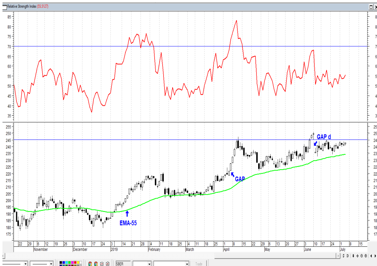
График акций Сбербанка

* Акции для сравнения с Портфелем УТ считаются купленными по средневзвешенным ценам 18.03.2019 г.