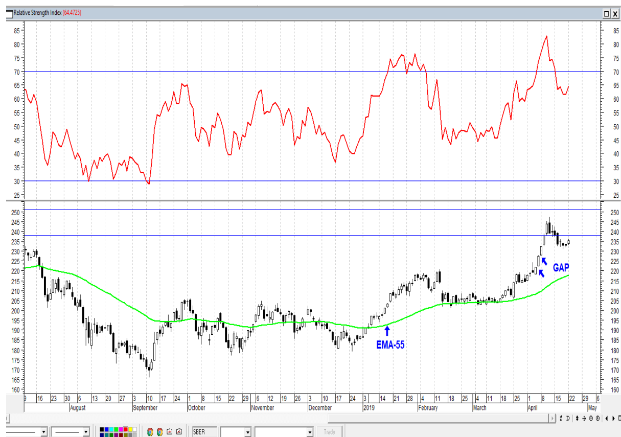
График акций Сбербанка

* Акции для сравнения с Портфелем УТ считаются купленными по средневзвешенным ценам 18.03.2019 г.