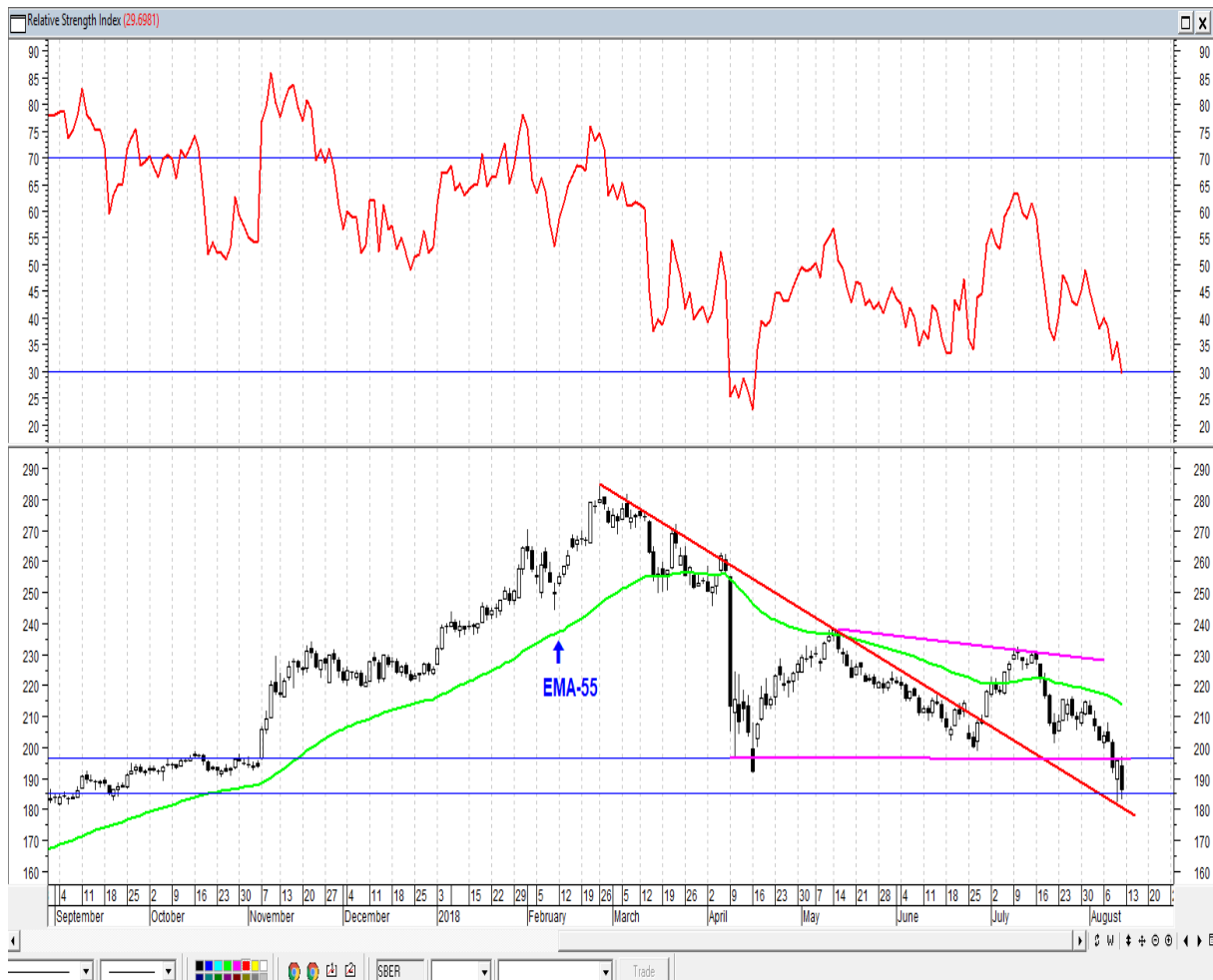
График акций Сбербанка

* Акции для сравнения с Портфелем УТ считаются купленными по средневзвешенным ценам 10.05.2018 г.