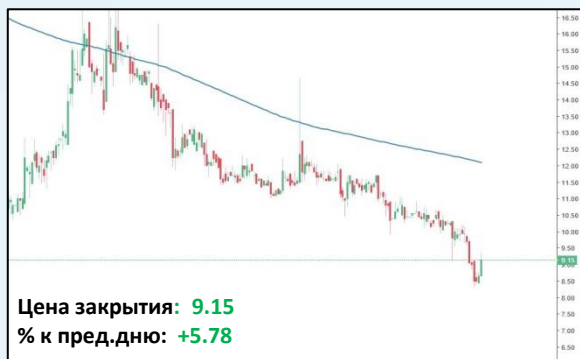
ИСКЧ , Daily