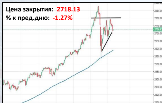
Индекс S&P500, Daily