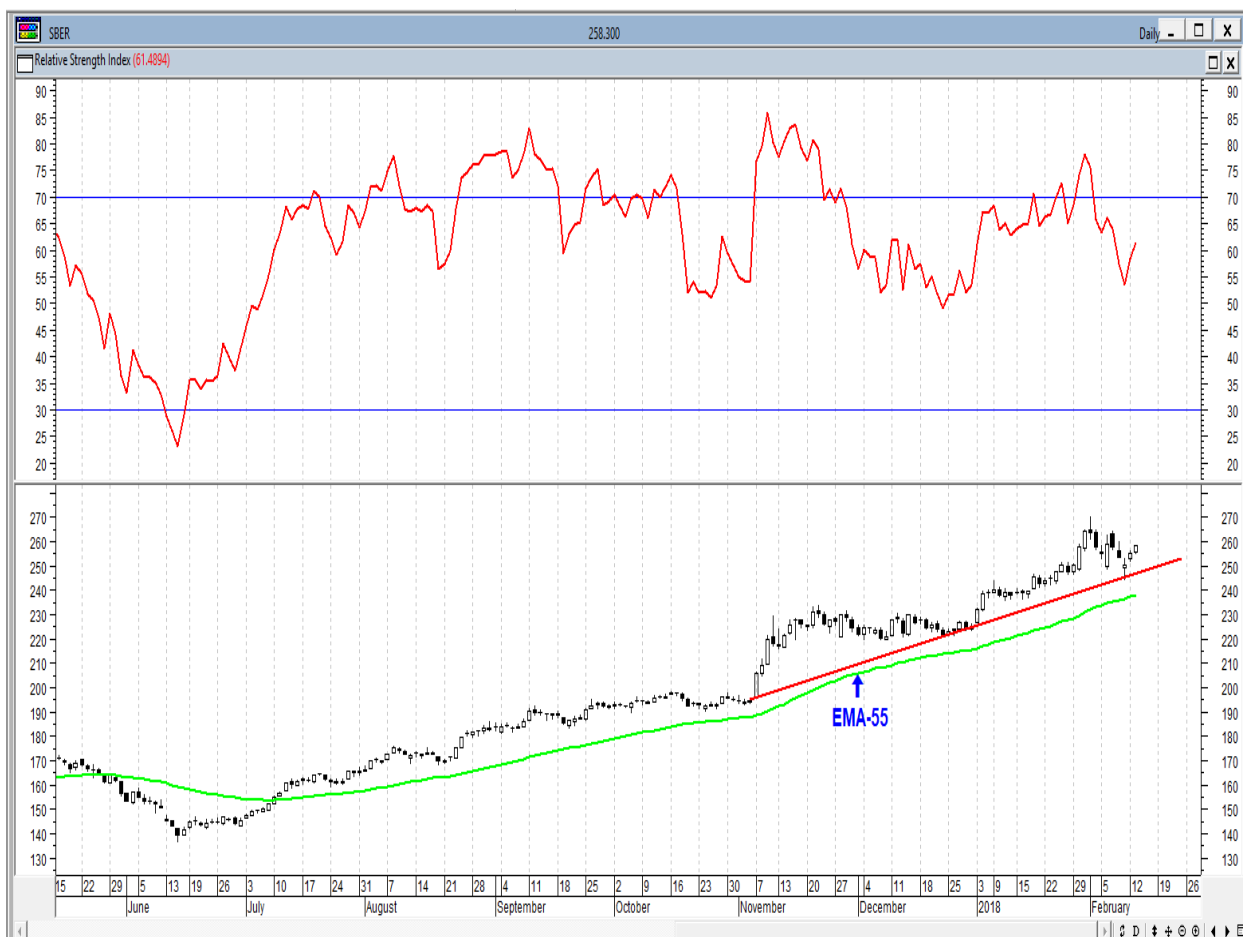
График акций Сбербанка

* Акции для сравнения с Портфелем УТ в прошлом цикле считаются купленными по средневзвешенным ценам 10.01.2018 г.