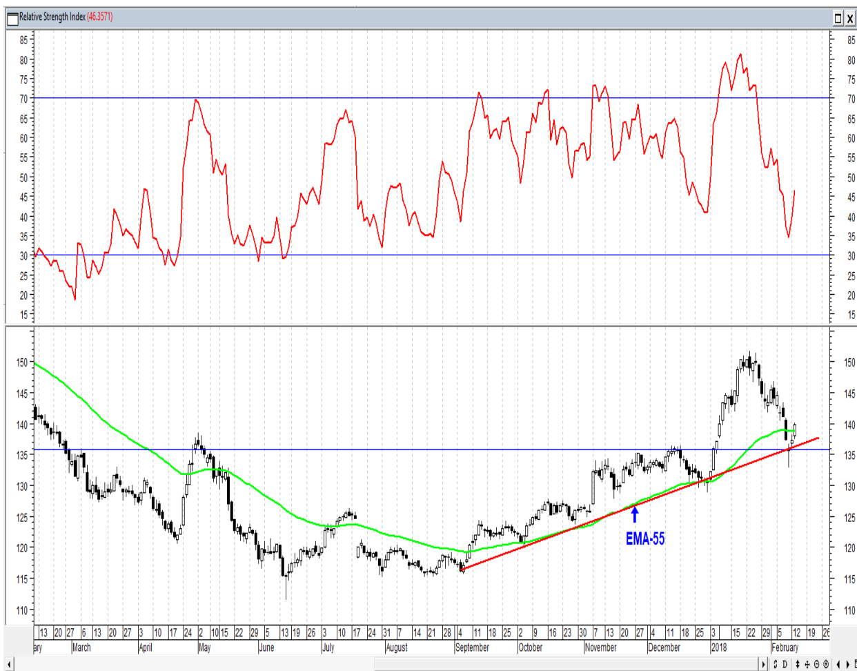
График акций ГМК НорНикель