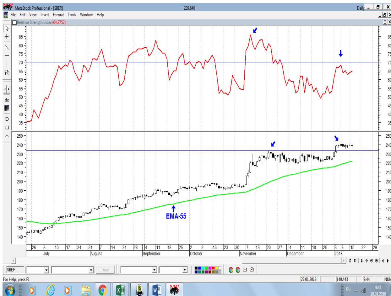
График акций Сбербанка

* Акции для сравнения с Портфелем УТ в прошлом цикле считаются купленными по средневзвешенным ценам 10.01.2018 г.