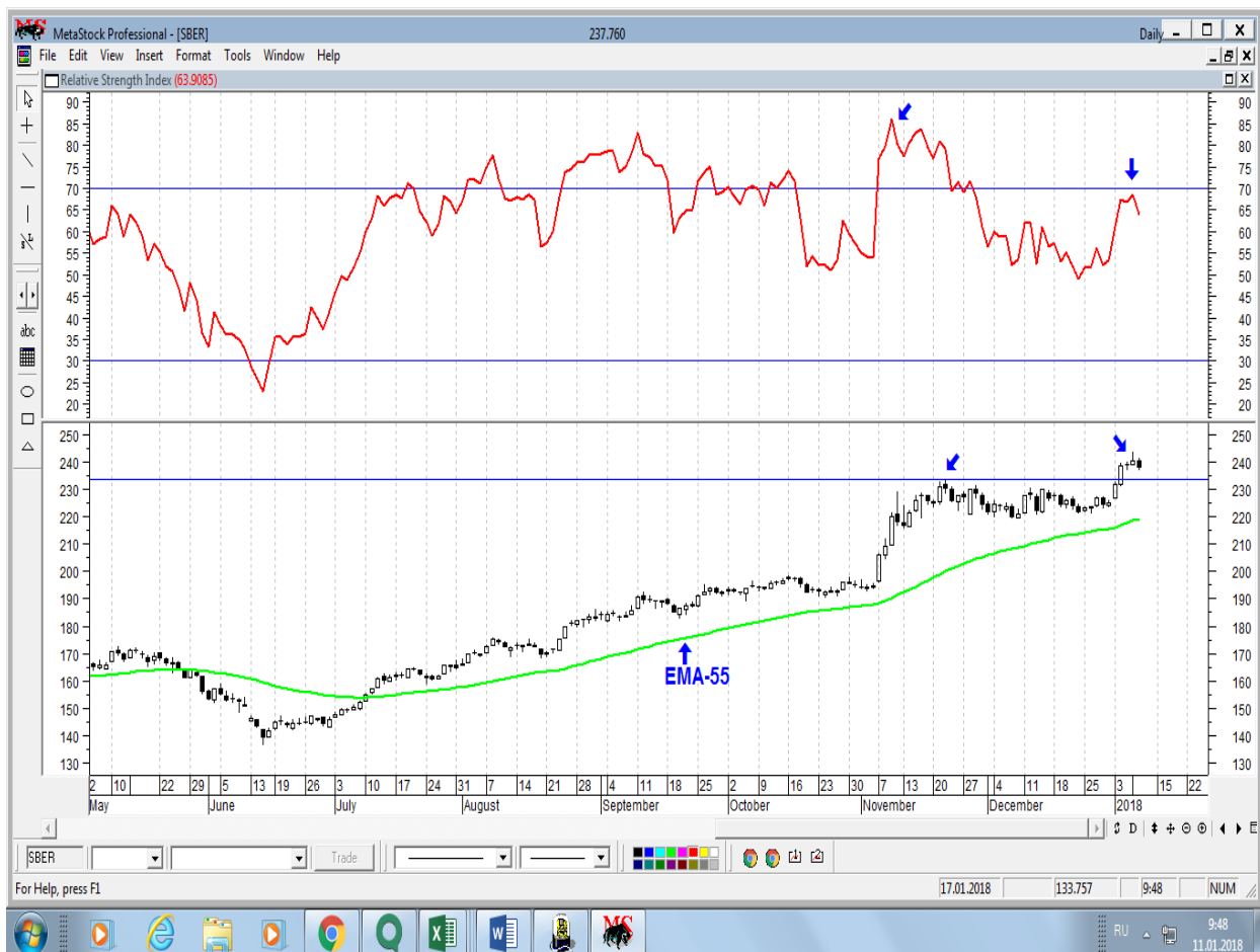
График акций Сбербанка

* Акции для сравнения с Портфелем УТ в прошлом цикле считаются купленными по средневзвешенным ценам 10.01.2018 г.