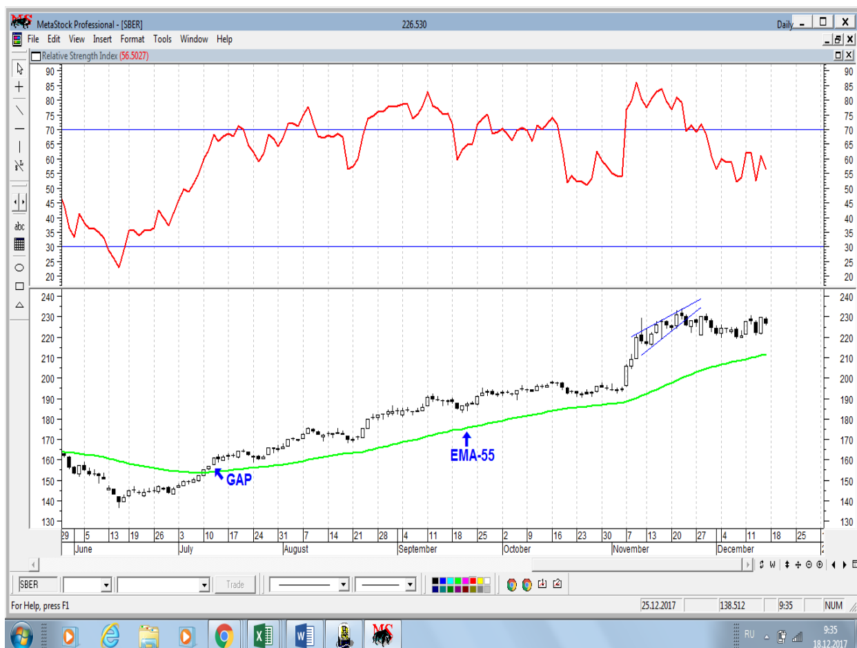
График акций Сбербанка

* Акции для сравнения с Портфелем УТ в прошлом цикле считаются купленными по средневзвешенным ценам 04.07.2017 г.