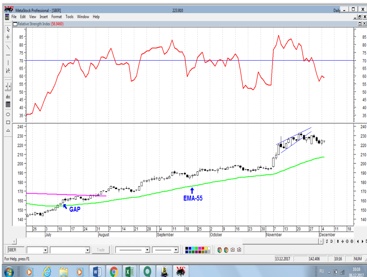
График акций Сбербанка

* Акции для сравнения с Портфелем УТ в прошлом цикле считаются купленными по средневзвешенным ценам 04.07.2017 г.