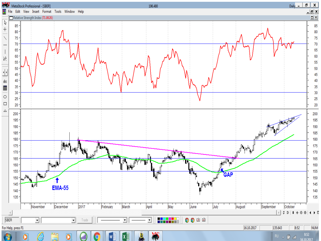
График акций Сбербанка

* Акции для сравнения с Портфелем УТ в прошлом цикле считаются купленными по средневзвешенным ценам 04.07.2017 г.