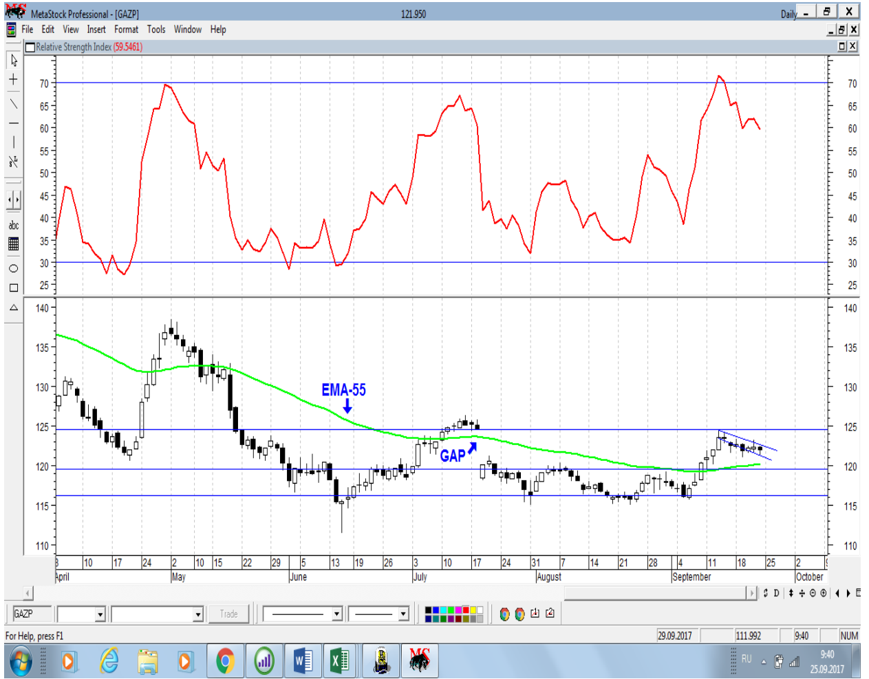
График акций ГМК НорНикель