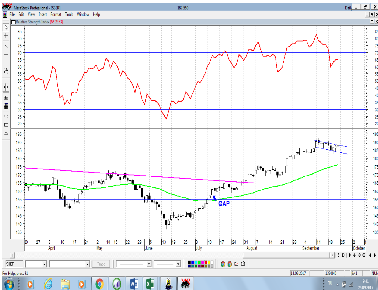
График акций Сбербанка

* Акции для сравнения с Портфелем УТ в прошлом цикле считаются купленными по средневзвешенным ценам 04.07.2017 г.