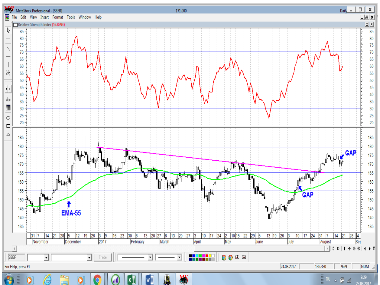
График акций Сбербанка

* Акции для сравнения с Портфелем УТ в прошлом цикле считаются купленными по средневзвешенным ценам 04.07.2017 г.