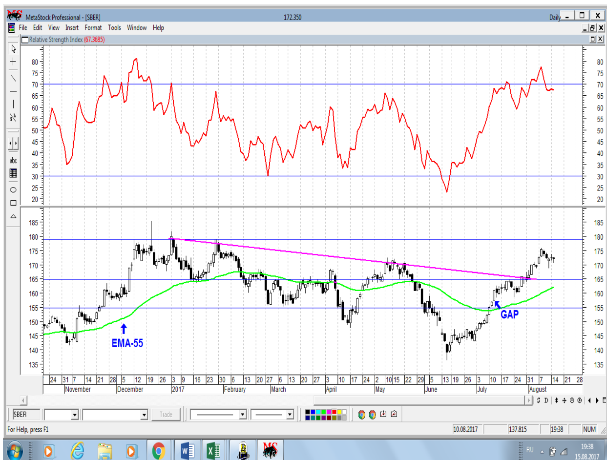
График акций Сбербанка

* Акции для сравнения с Портфелем УТ в прошлом цикле считаются купленными по средневзвешенным ценам 04.07.2017 г.