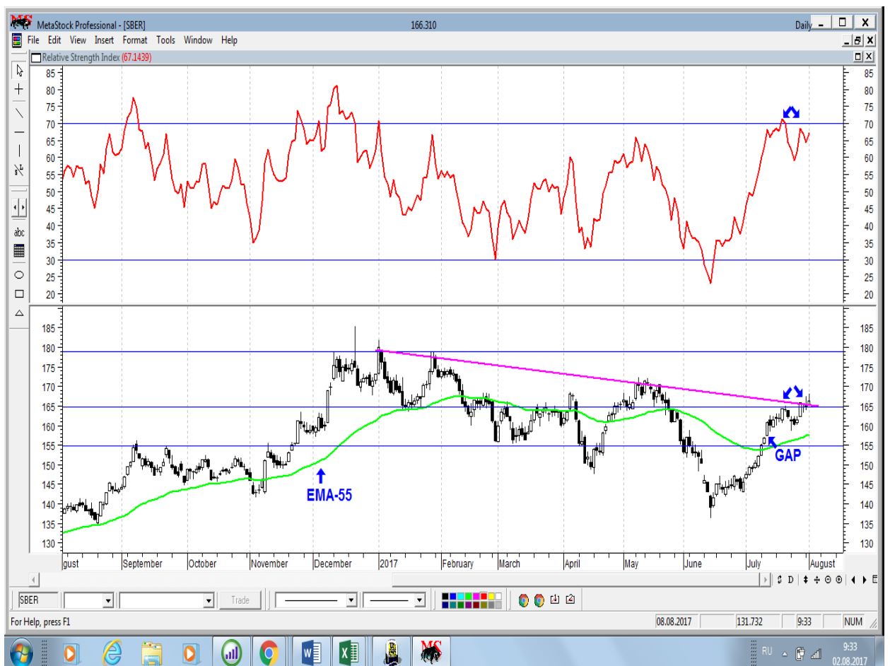
График акций Сбербанка

* Акции для сравнения с Портфелем УТ в прошлом цикле считаются купленными по средневзвешенным ценам 04.07.2017 г.