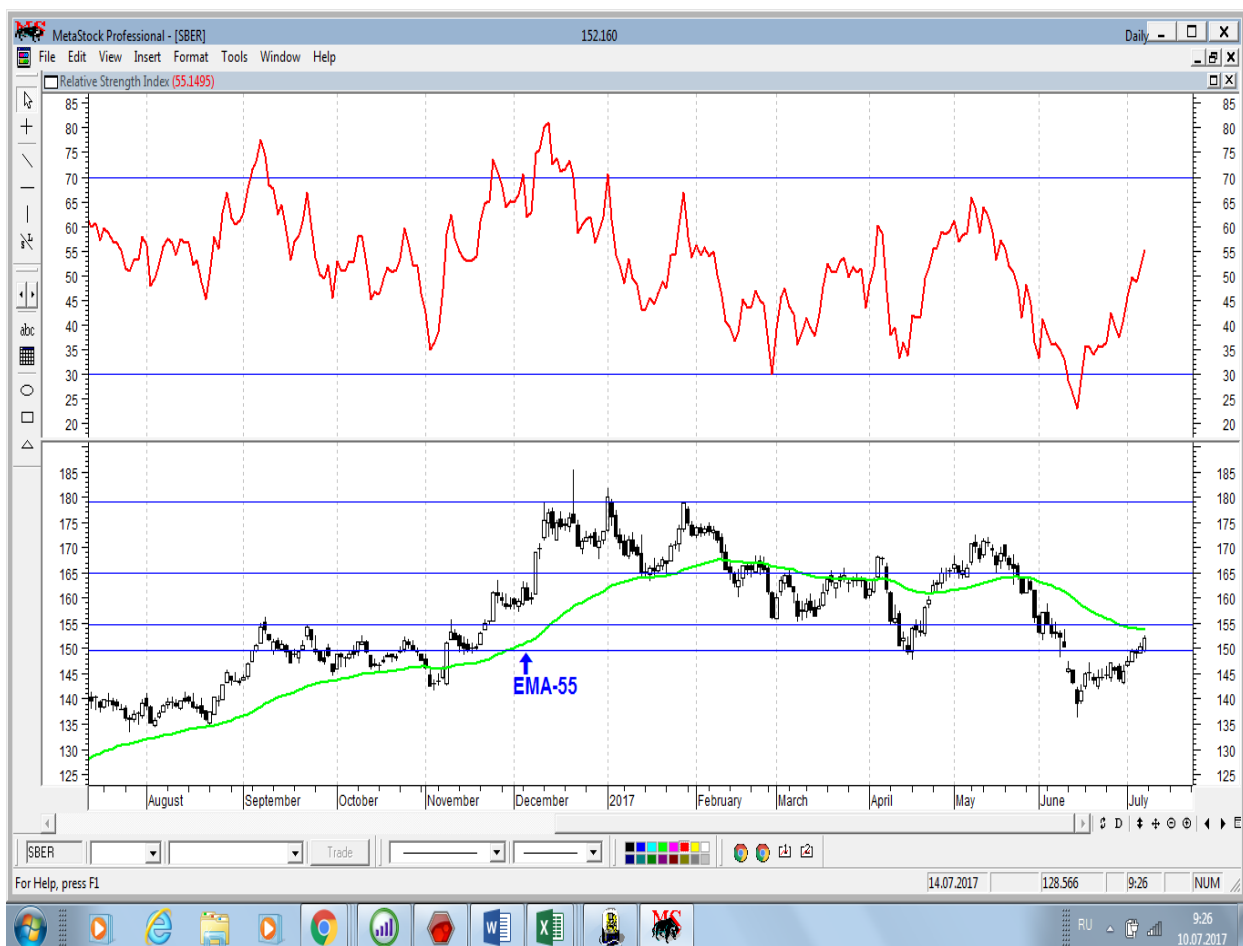
График акций Сбербанка

* Акции для сравнения с Портфелем УТ в прошлом цикле считаются купленными по средневзвешенным ценам 04.07.2017 г.